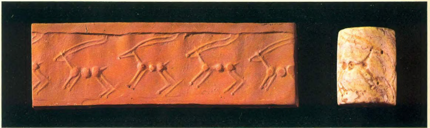
Cilindro-sello babilónico con su correspondiente desarrollo en arcilla, del III milenio antes de J. C. (Museo del Monasterio de Montserrat, Barcelona).

reliquia de otra religión más antigua, al modo de Cronos, el padre de Zeus.